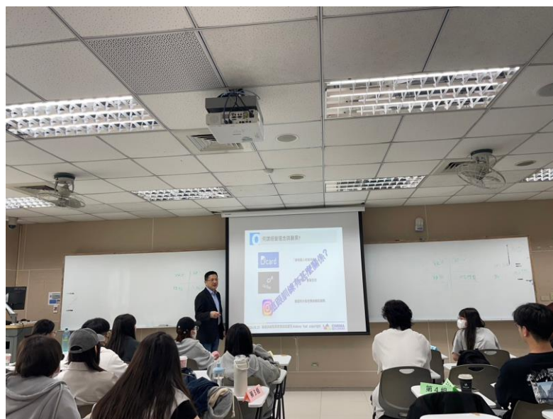
113 年 3 月 23 日 工作坊實況