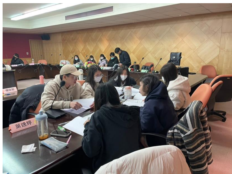
113 年 3 月 9 日 工作坊實況- 參與學生進行 案例討論