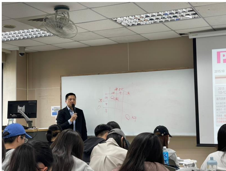
113 年 3 月 23 日 工作坊實況