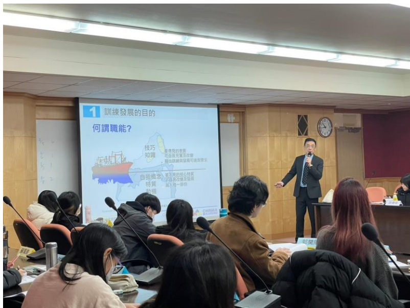
113 年 3 月 9 日 工作坊實況