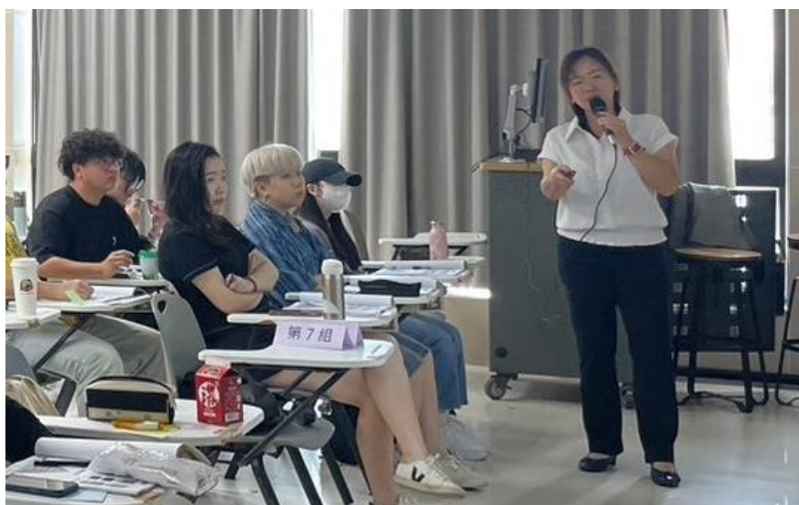
113 年 4 月 20 日 工作坊實況