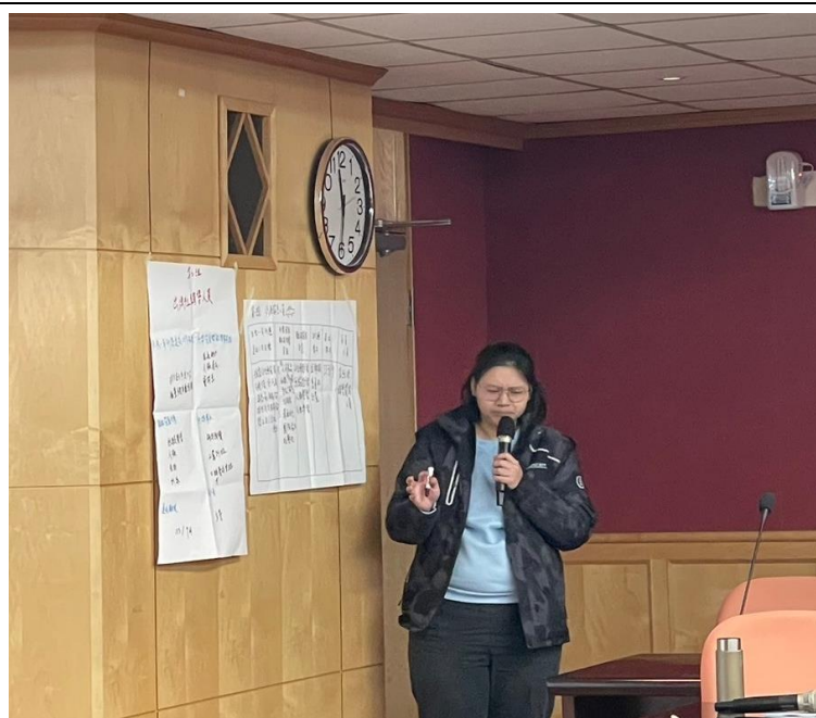
113 年 3 月 9 日 工作坊實況- 參與學生案例討論 發表成果