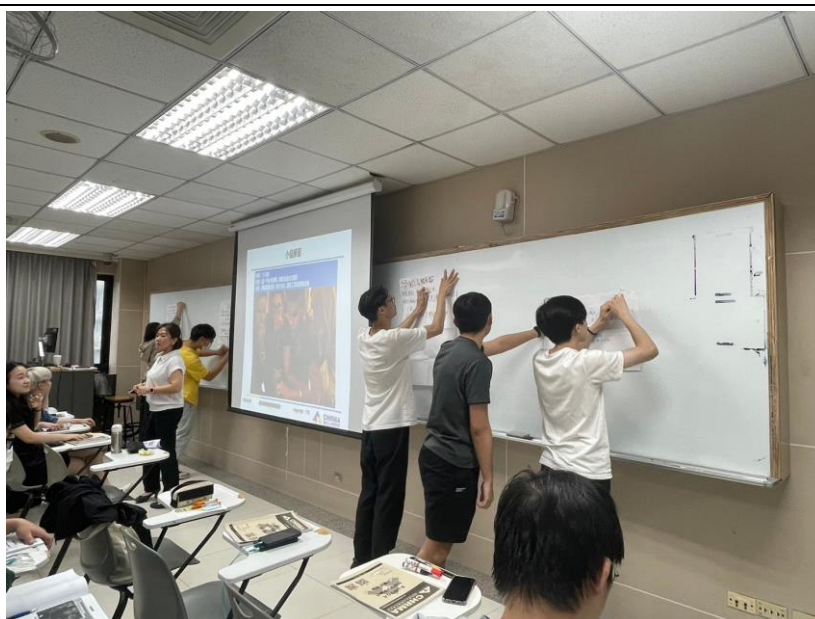
113 年 4 月 20 日 工作坊實況