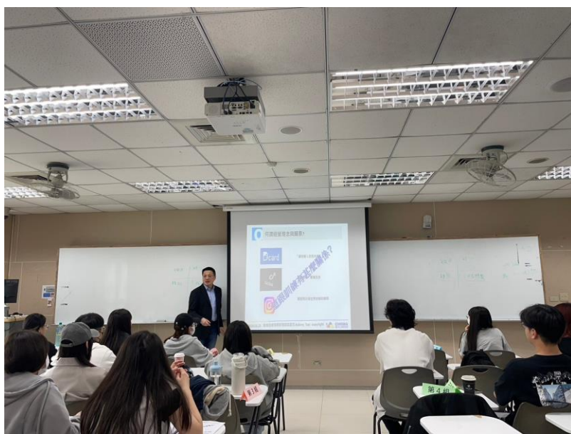
113 年 3 月 23 日 工作坊實況