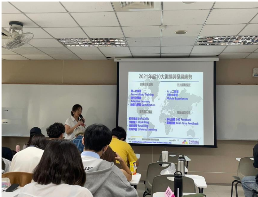
113 年 4 月 20 日 工作坊實況