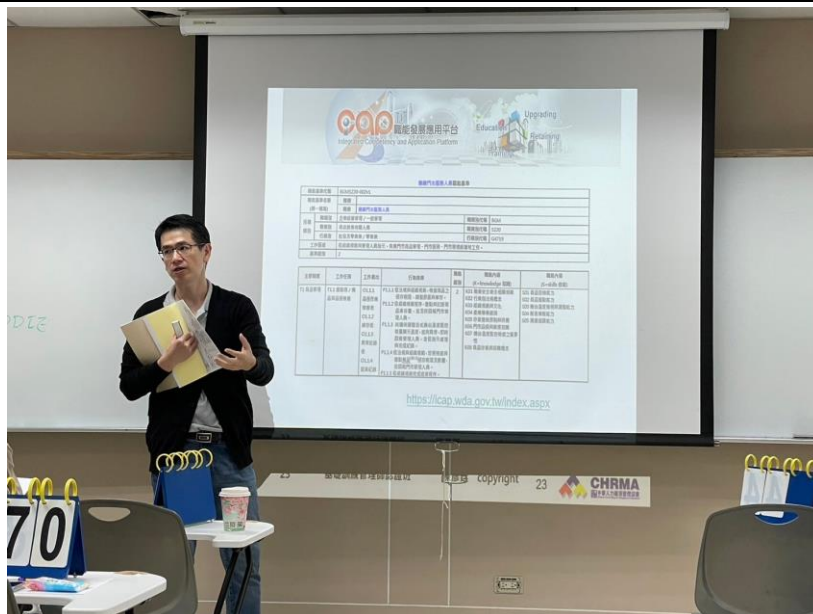
113 年 3 月 30 日 工作坊實況