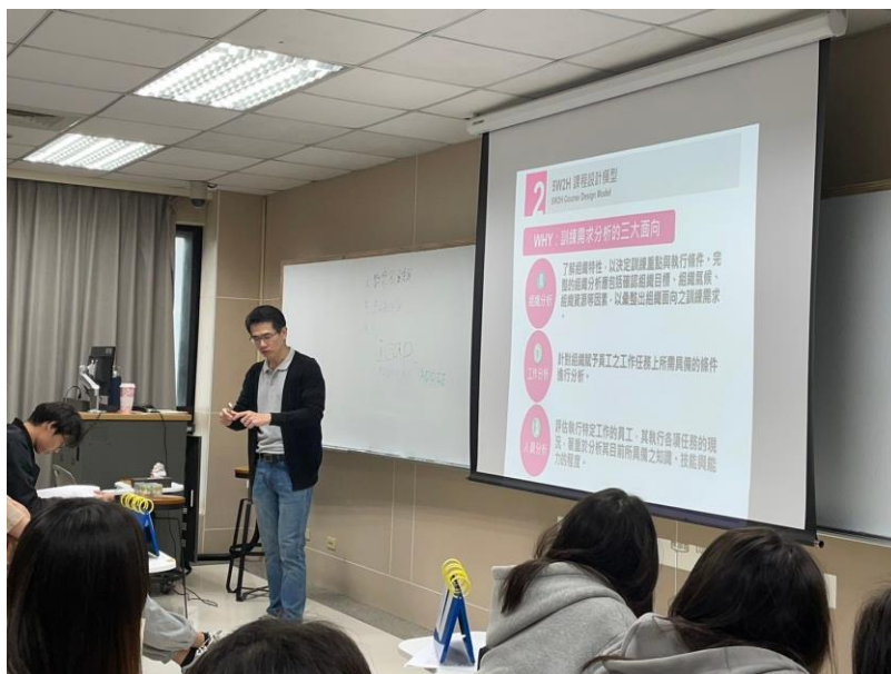
113 年 3 月 30 日 工作坊實況